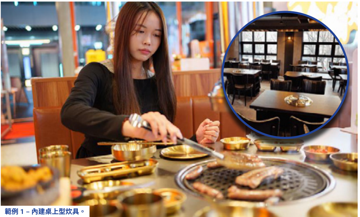
範例 1 – 內建桌上型炊具。

本文檔所指的便攜式瓦斯烹飪設備是指具有封閉式氣罐的便攜式烹飪設備，氣罐內裝有加壓丁烷氣作為燃料。以下是一些範例。